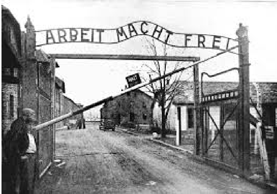
Dit is de poort van vernietigingskamp Auschwitz. Het betekent: 'Arbeid maakt vrij'. Maar uiteindelijk werden bijna alle mensen er doodgemaakt.