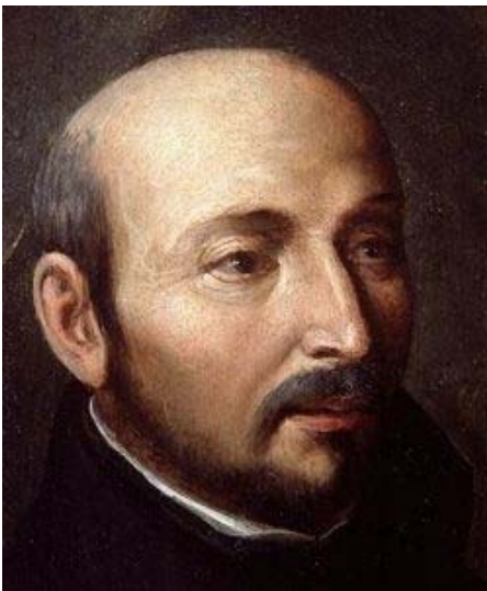
Ignatius van Loyola 6 maart 2018