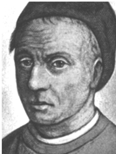
Thomas a Kempis 22 maart 2018