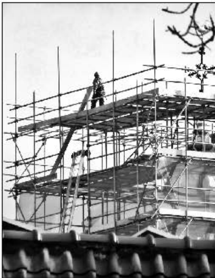
De toren van de Oude Kerk in de steigers.

Acties restauratie toren voor alle lezers!